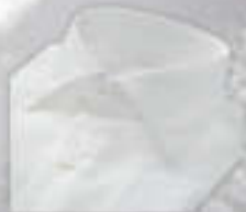
Hemd nach Maß 99 Euro