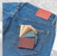
Jeans nach Maß 239 Euro