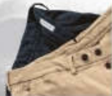
Chino nach Maß 239 Euro