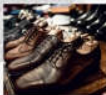
Rahmengenähte Herrenschuhe 359 Euro